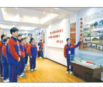
向群中学的同学们参观李向群纪念馆，聆听李向群的故事。

3月30日，公安县第二中学团委组织50余名优秀共青团员代表，来到李向群烈士墓前，开展“缅怀先烈志，共铸中华魂”主题祭扫活动，追思抗洪英雄，传承红色精神。高二（1）班邵子谦同学走进李向群纪念馆，在李向群的日记本前驻足