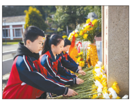
在黄静源烈士殉难处纪念碑前，少先队员为烈士敬献鲜花。