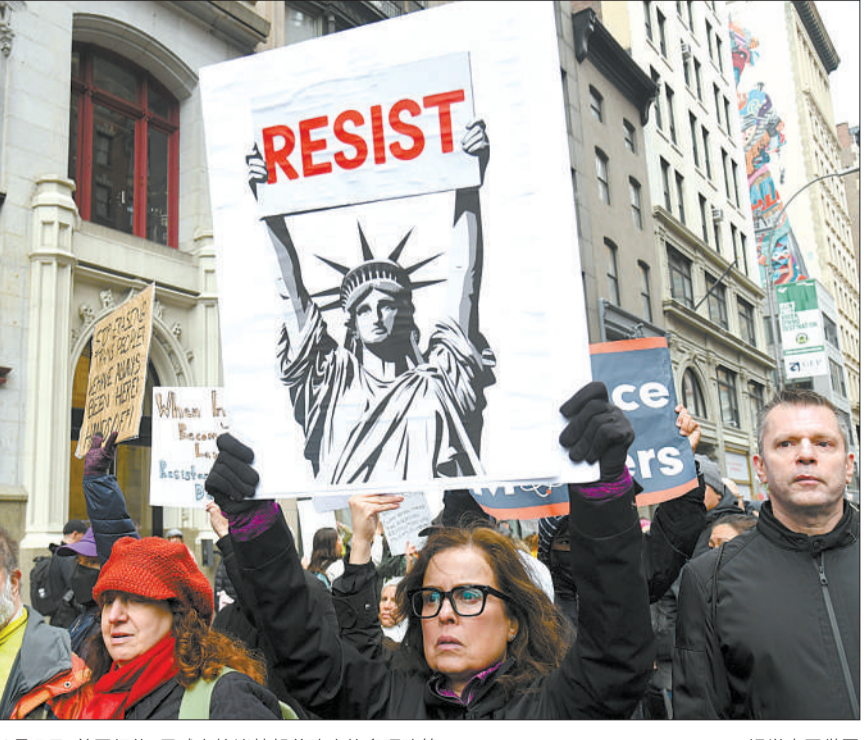
4月5日，美国纽约，示威者抗议特朗普政府的政策。