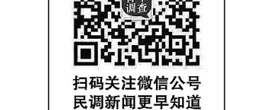
扫码关注微信公众号 民间新闻早知道

受访者中，00后占1.0%，90后占19.8%，80后占52.4%，70后占20.3%，60后占4.9%，50后占1.3%。